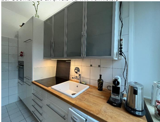
Küche (Der Vermieter bietet seine Kücheneinrichtung zur Übernahme an (Preis VB mit Vermieter)