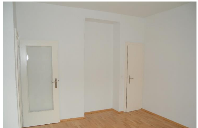
Schlafzimmer mit Abstellkammer