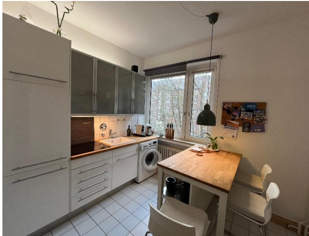
Küche (Der Vermieter bietet seine Kücheneinrichtung zur Übernahme an (Preis VB mit Vermieter)