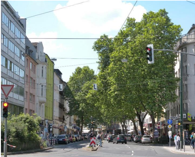
Einkaufzone Rethelstraße in fußläufiger Nähe