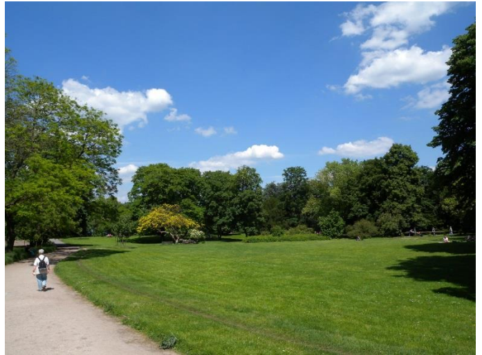
Der nur ca. 500m entfernte „Zoopark“ lädt zur Naherholung ein.