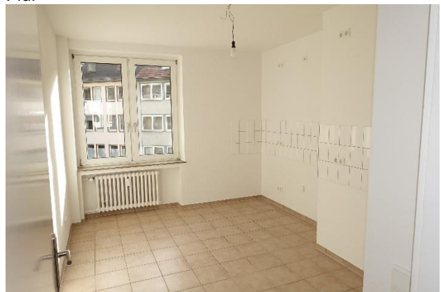
Küche (hier noch ohne Einbauküche)