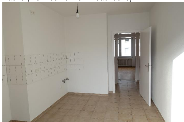
Küche (hier noch ohne Einbauküche)